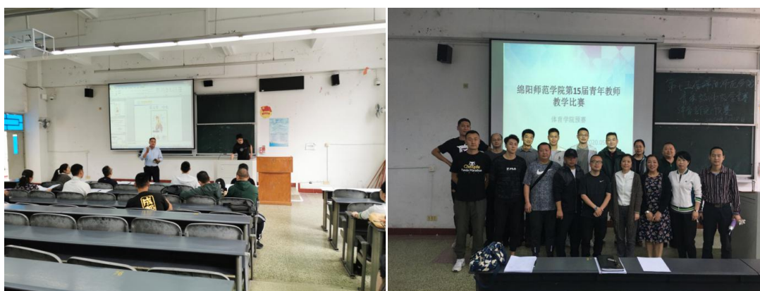
体育与健康教育学院