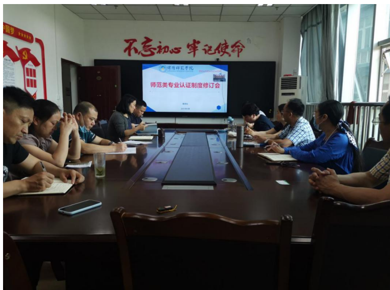
师范专业认证会议

为进一步加强教学系统制度的“废改立”工作，强化和落实依法治教意识，提高治理效能，有效助推我校师范类专业认证工作，5月20日下午，教学系统师范类专业认证制度修订会在高新校区知行楼122会议室召开。教务处、教学质量监控与评估中心、教师技能实训中心的科、处长参加了会议，会议由教务处长、质控中心主任邹洪伟教授主持。