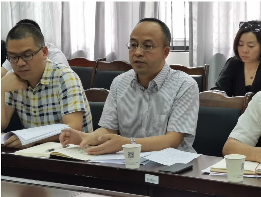
文：任秀蓉 图：李彬 审核：邹洪伟

最后陈寒副校长就2020年专升本工作强调了三点要求：一是所有工作人员要严守纪律，律人律己，务必做好安全保密工作；二是各学院要准确理解文件精神，宣传落实到位，严格遵守工作程序；三是各级工作人员要履职尽责，认真细致，保证工作不出差错。