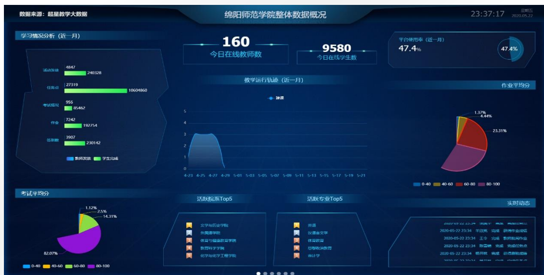
(学习通平台整体数据监控情况 2)